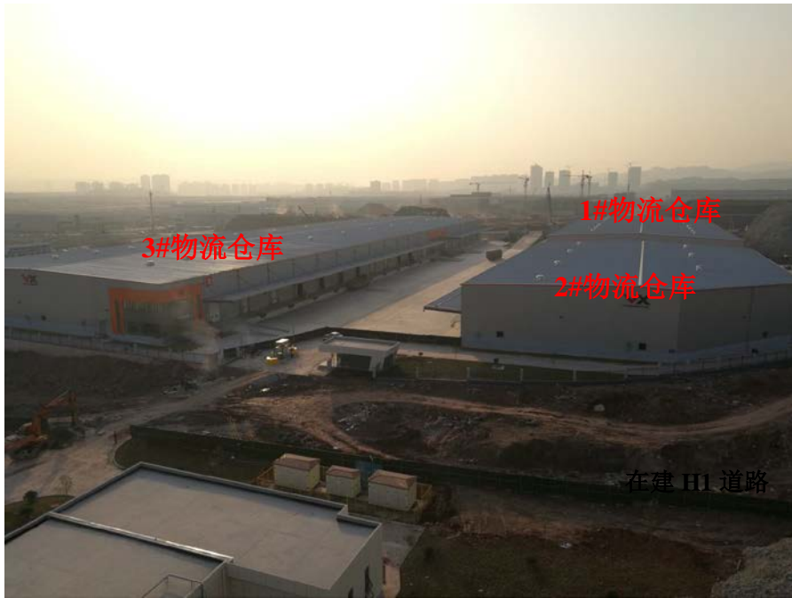
K05-4/02 (北) 地块